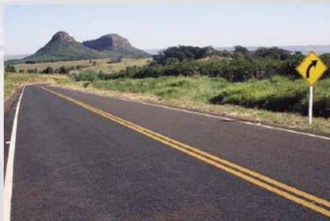
Rodovia MG-344, trecho Claraval e Ibiraci, pavimentada no programa PROCESSO

de pesquisa e engenharia de tráfego; estatísticas de acidentes; gerência de pavimentos; autorizações especiais de trânsito; gestão e controle de operação viária e gestão de melhoramento ambiental, os quais permitirão ao DER/MG alcançar novos patamares de eficiência no gerenciamento da malha viária estadual. A informatização de diversos processos produtivos, desenvolvida no âmbito do PROCESSO, é mais um case bem sucedido na parceria entre o Governo do Estado de Minas Gerais e a Softplan/Poligraph.