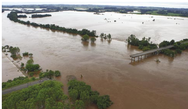
Vista dos estragos causados na queda de uma ponte sobre o Rio Jacuí, na RSC-287, em Agudo, Rio Grande do Sul.